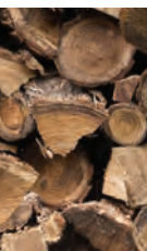
TABLE SAW SERIES 600R/700R COULD BE SUPPLY WITH THREE-POINTS PTO, AC230/400 VOLTS ELECTRIC OR ENGINE MOTOR, DIAMETER 600 - 700 MM, BELT DRIVE TRANSMISSION.

BANCO SEGA SERIE 600R/700R CON ATTACCO A TRE PUNTI FRONTALE, CON MOTORE MONOFASE/TRIFASE, O CON MOTORE TERMICO, LAMA DIAMETRO 600 - 700 MM, TRASMISSIONE A CINGHIE.